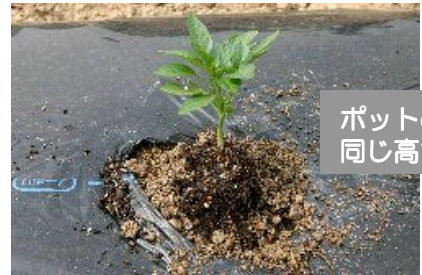
ポットの土が同じ高さに

「元気に育ってね」と声をかけてあげよう。植えるとき、種を蒔くとき、水をあげるときは