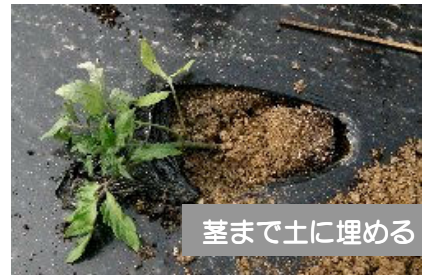
茎まで土に埋める